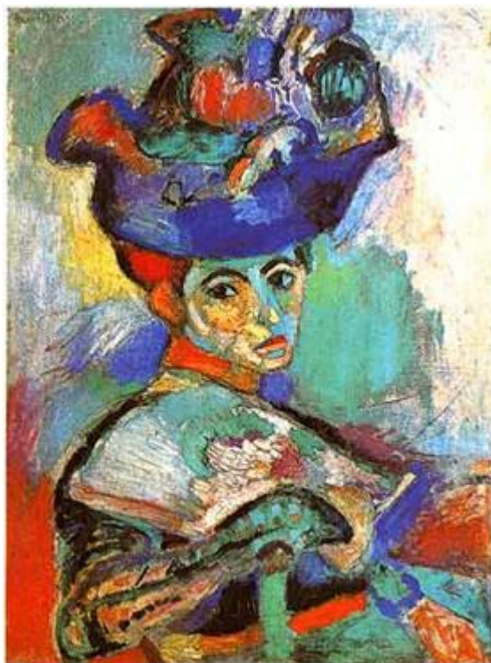
Woman with the Hat