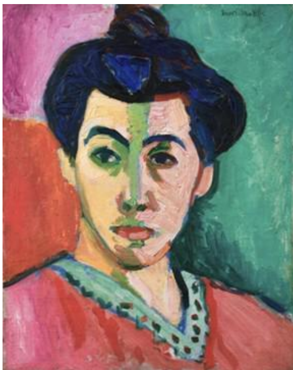
Το πορτρέτο της κυρίας Ματίς