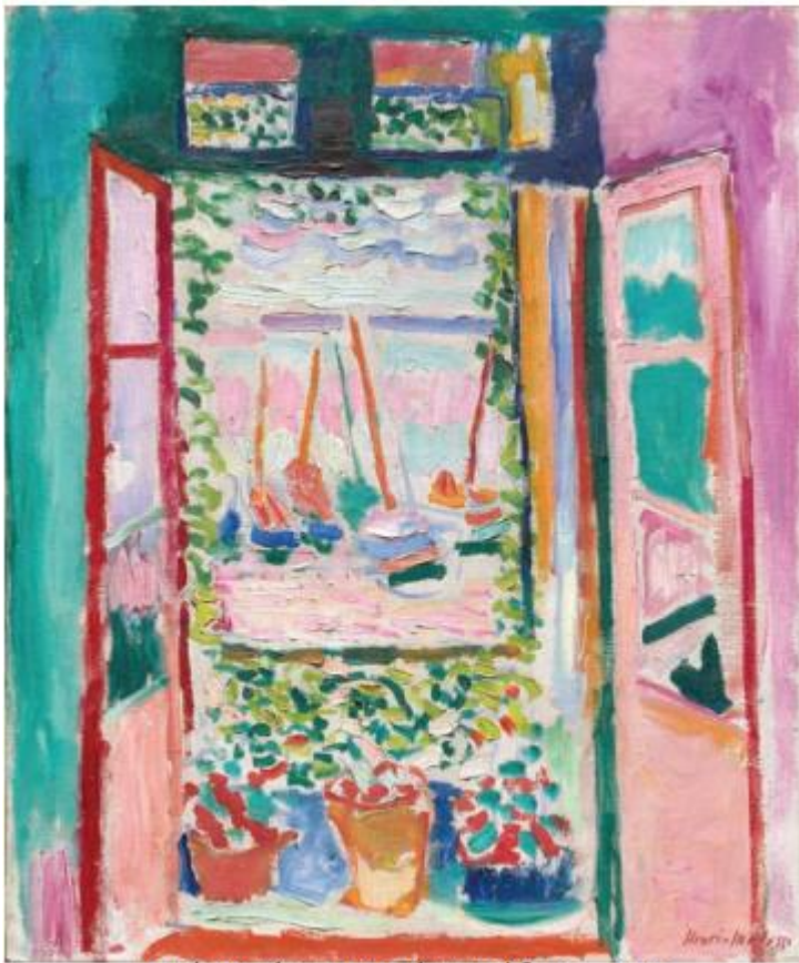
Ανρί Ματίς, Ανοιχτό Παράθυρο, 1905

γ) Γράψε τι θα έλεγες σ' έναν φίλο σου για τον πίνακα: